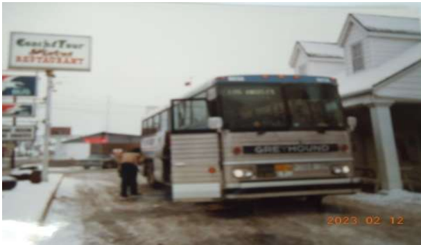
ミールストップ(食事休憩)・氷点下のミズーリ州 1980年当時、アメリカクルーザー社製だったと聞いたが現在は MCI (モーター・コーチ・インダストリー社)製か・・・。