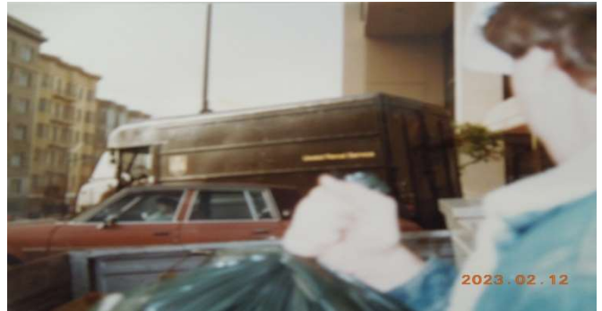
通称「ビッグブラウン」。ブラウンカラーのUPS(ユナイテッドパー セルサービス)社はアメリカ最大の宅配会社。約250機の貨物 専用航空機を保有している。都市部集配のウォークスルー車。